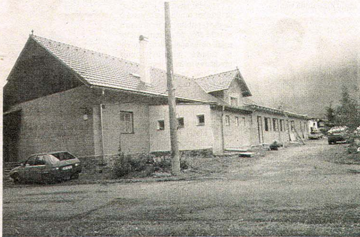
ZÁZEMÍ budoucího hospice a sanatoria ve Velké Chmelné vzniká rekonstrukcí bývalého hostince, který byl zakoupen ze soukromých peněz.

„Rekonstrukci provádíme po zaměstnání ve svém vol-