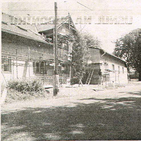
REKONSTRUKCE je dobrovolníky prováděna v jejich volném čase po zaměstnání.