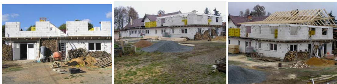
Postup rekonstrukčních prací – zastřešování přístavby